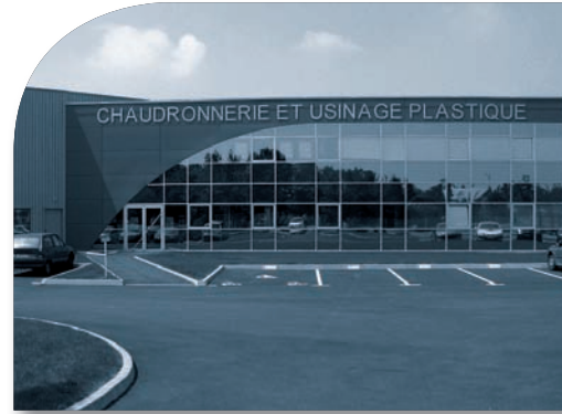
L'usine JSP au Cellier (Loire-Atlantique)

Les équipements de chantier auto-portatifs, les échafaudages et passerelles, constituent les moyens nécessaires pour s'adapter à toutes les configurations de sites. Au cas par cas, dans des environnements spécifiques, JSP peut faire appel à des moyens de manutention ou de levage spécifiques, comme des nacelles articulées.