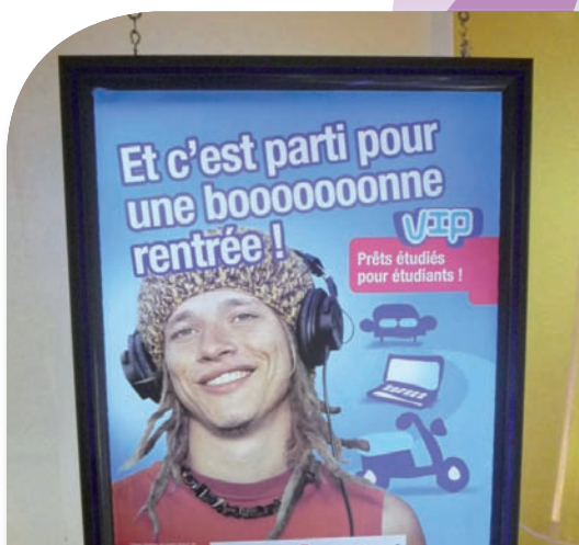
Réalisation et entretien de panneau à éclairage tangentiel.