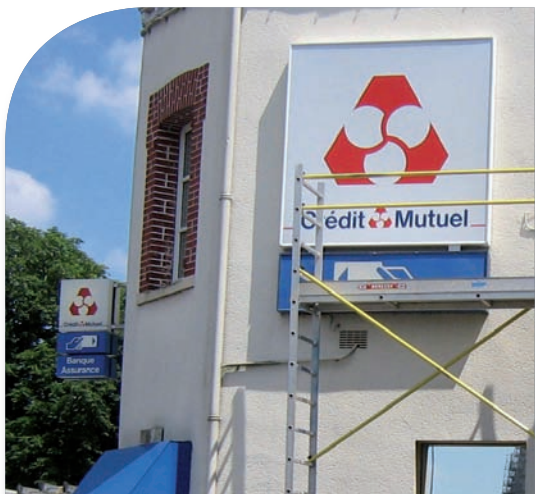
Mise en place d'enseignes.