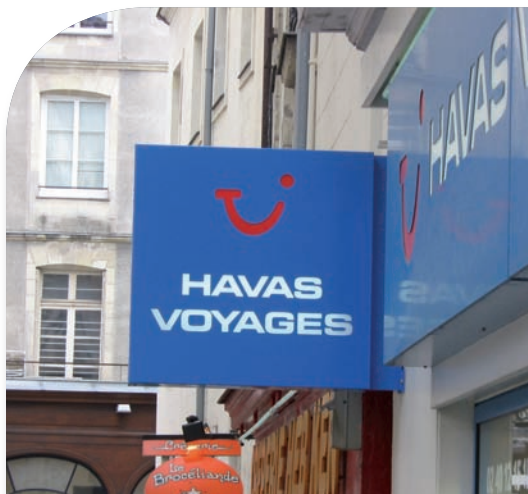
Mise en place d'enseignes.