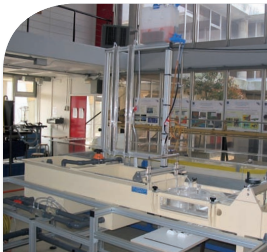
Montage d'ensemble technique.