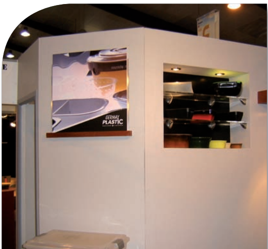
Réalisation et montage de stand.