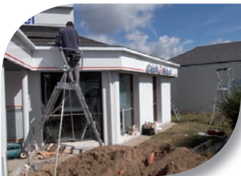
Pose d'une enseigne.

Afin de répondre au mieux à ces obligations, JSP assure de manière récurrente, la formation continue à son personnel. Ces formations peuvent être pratiques et préventives, avec des modules propres aux techniques de poses et aux risques liés au travail de chantier. De plus, les habilitations électriques sont renouvelées périodiquement.