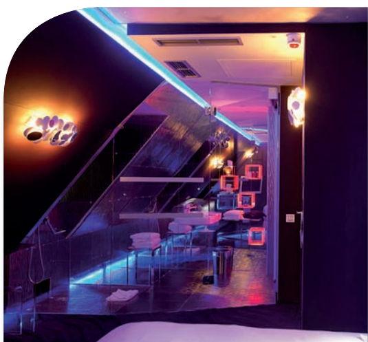
Finition sur site de mobilier.